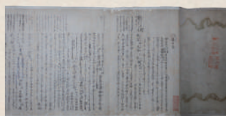
賀茂真淵自筆稿本 祝詞考(慶應義塾大学斯道文庫)