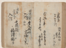
通々斎塾姓名録(日本学士院)