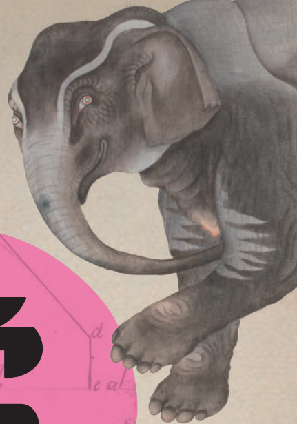
唐蘭船持渡鳥獸之図 (慶應義塾図書館)