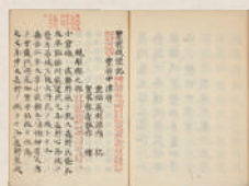
豊前城堡記(龍谷大学図書館)