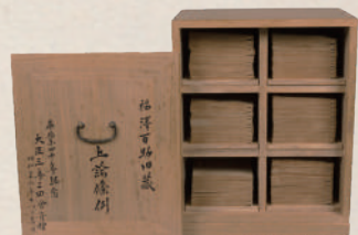
福澤百助旧蔵 上諭条例(慶應義塾図書館)