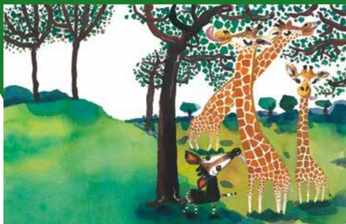
「オカピぼうやのちいさなぼうけん」 2021年

1961年、大阪府藤井寺市生まれ。 『おじいちゃんのおじいちゃんのおじいちゃんのおじいちゃん』(BL出版)で絵本デビュー。 『いいからいいから』(絵本館)、『へいわってすてきだね』(プロンズ新社)、『おならまんざい!』(小学館)など、ユーモラスでおおらかな絵本が大人にも子どもにも大ウケ。 毎日放送のスケッチ散策で、お茶の間にも人気。