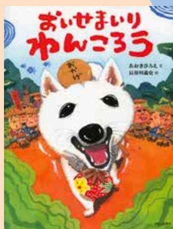
「おいせまいりわんころろ」 2019年