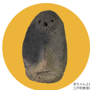
赤ちゃん土偶 三戸町教育委員会蔵

中津市本耶馬溪町に所在する縄文時代の遺跡「粉洞穴」。8次にわたる発掘調査が行われ、68体の縄文人の骨が発見されています。粉洞穴の縄文人たちはどのような一生を送ったのか。県内外で発掘された資料とともに縄文の人生を紹介します。