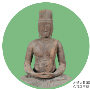
木造大日如来坐像 久福寺所蔵

古くから、奇岩奇勝で知られる耶馬溪の景観に人々は神や仏の姿を見出してきました。本展では、古代から近世に至るまで、この地に祀られてきた神仏を一同に会し、聖地としての耶馬溪を見つめなおします。