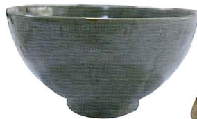
「龍泉窯系青磁碗」長久寺所蔵