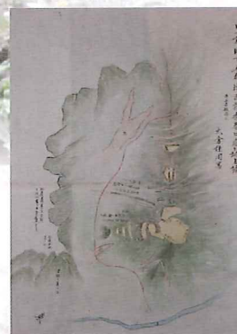
「豊前国下毛郡津民荘香春口屋ヶ城之墟」

開館時間：午前9時～午後5時(入館は午後4時30分まで) 11月6日は午後7時まで開館(入館は午後6時30分まで) 休館日：月曜日(月曜日祝日の場合はその翌日) 観覧料：一般300円、団体100円(20人以上)、中学生以下無料、障がい者割引有