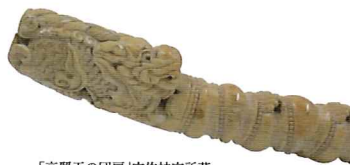
「高麗王の团扇」宇佐神宮所蔵