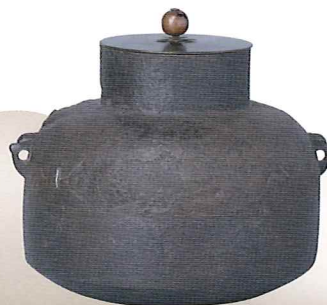
「芦屋釜」吉川史料館所蔵

豊前国と豊後国の境目にある中津は、大勢力の狭間に位置し、多くの土豪たちにより土塁や堀を備えた館や山城が築かれました。 本展覧会では、土豪が築いた城郭を紹介し、彼らに関する資料、一揆を平定した豊臣方に関する資料などを展示します。