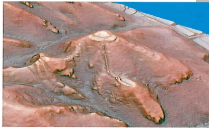
「長岩城跡赤色立体図」