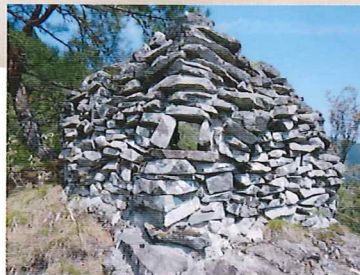
「長岩城跡馬蹄形(指門形)石積遺構」