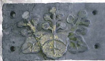
「金箔桐文飾瓦」大阪府教育委員会所蔵