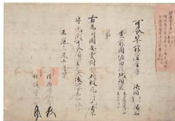
「関東下知状」個人・東京大学史料編纂所寄託