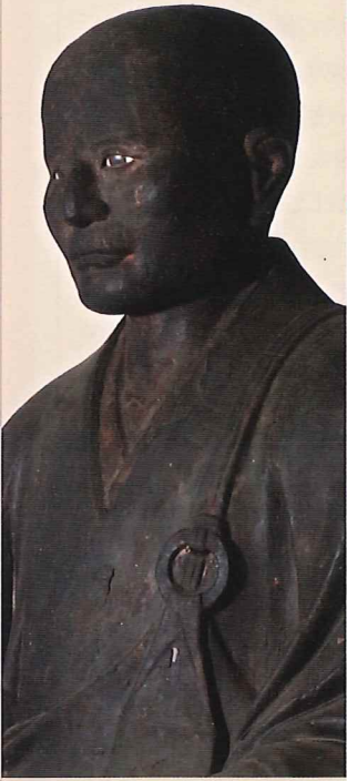
「木造俊仍律師坐像」 京都府指定有形文化財・泉涌寺