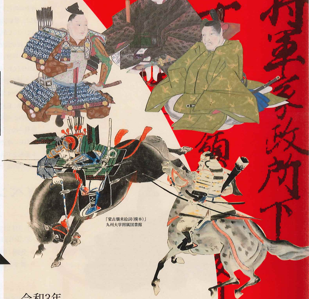
「蒙古襲来絵詞(模本)」 九州大学附属図書館