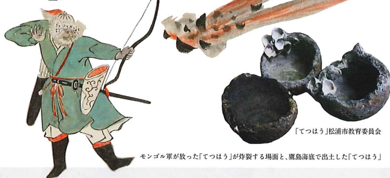
モンゴル軍が放った「てっほう」が炸裂する場面と、鷹島海底で出土した「てっほう」