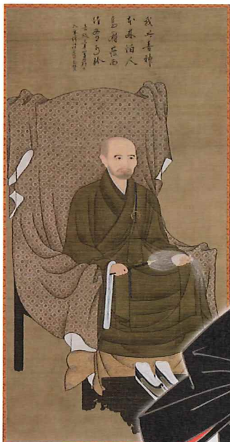
「俊仍律師像(模本)」泉涌寺