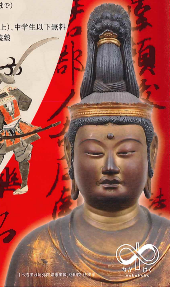
「木造宝冠阿彌陀如来坐像」恵徳院・快慶作